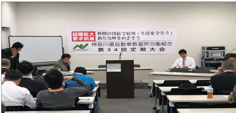
冒頭で挨拶する足利委員長